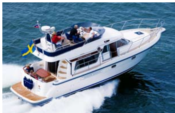
STOREBRO 410 COMMANDER