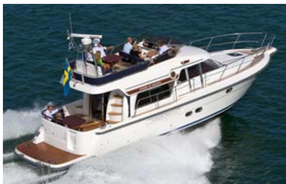
STOREBRO 435 COMMANDER