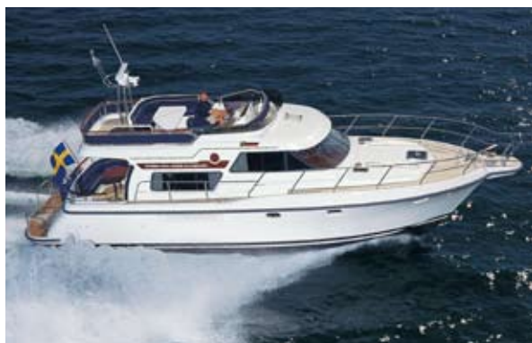
STOREBRO 475 COMMANDER