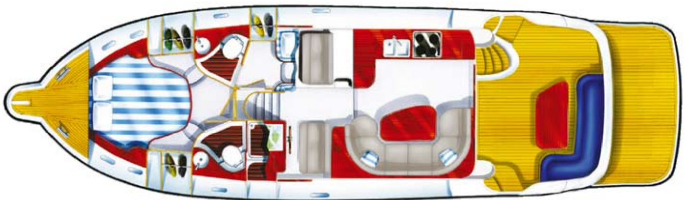
435 Commander 2-Kabinversion